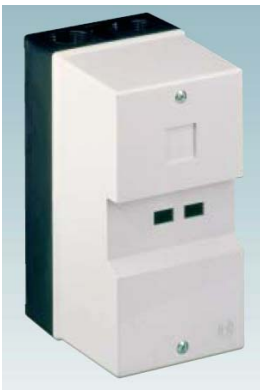
Foto dei prodotti / Products images